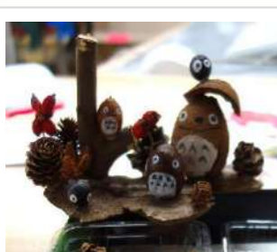
ネイチャーゲーム