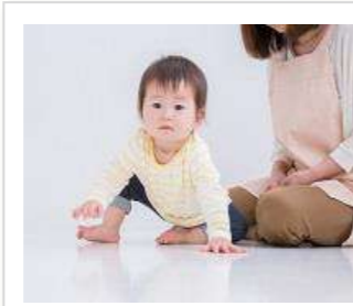
ベビー ハイハイレース

対象：1～6 歳の幼児 ※4 歳未満は保護者同伴 定員：15 名 料金：600 円 申込：11/9(土)より窓口・電話にて 会場：2 階 アリーナ