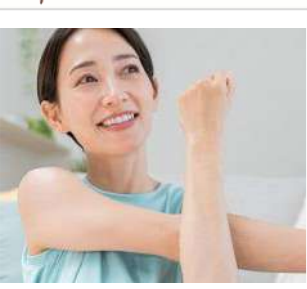
ママさん フィットネス

対象：1 歳の幼児 定員：なし 申込：11/9(土)より窓口・電話にて 会場：2 階 アリーナ